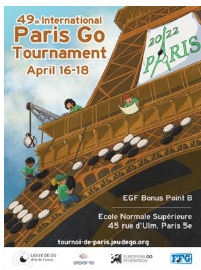
L'affiche de promotion 2022, réalisée par l'artiste « Stoned on the Goban »

Pour ce tournoi, nous avons eu l'honneur d'inviter, avec l'aide de donations des joueurs et de la Fédération Française de Go, de jeunes membres prometteurs de la Fédération Ukrainienne de Go, réfugiés d'Odessa, de Kyiv et Rivne. Ils ont pu bénéficier de l'accueil chaleureux de la communauté des joueurs de Go.