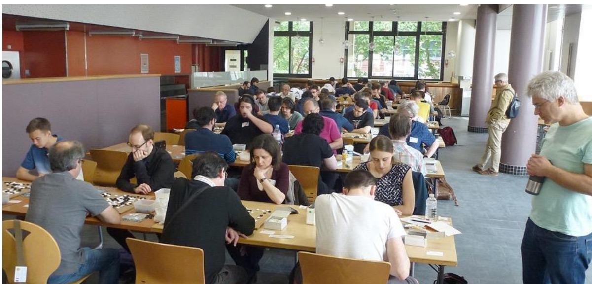
La salle principale du tournoi

Des événements annexes sont également organisés lors de ces trois jours, en particulier un tournoi de blitz et des commentaires de parties.