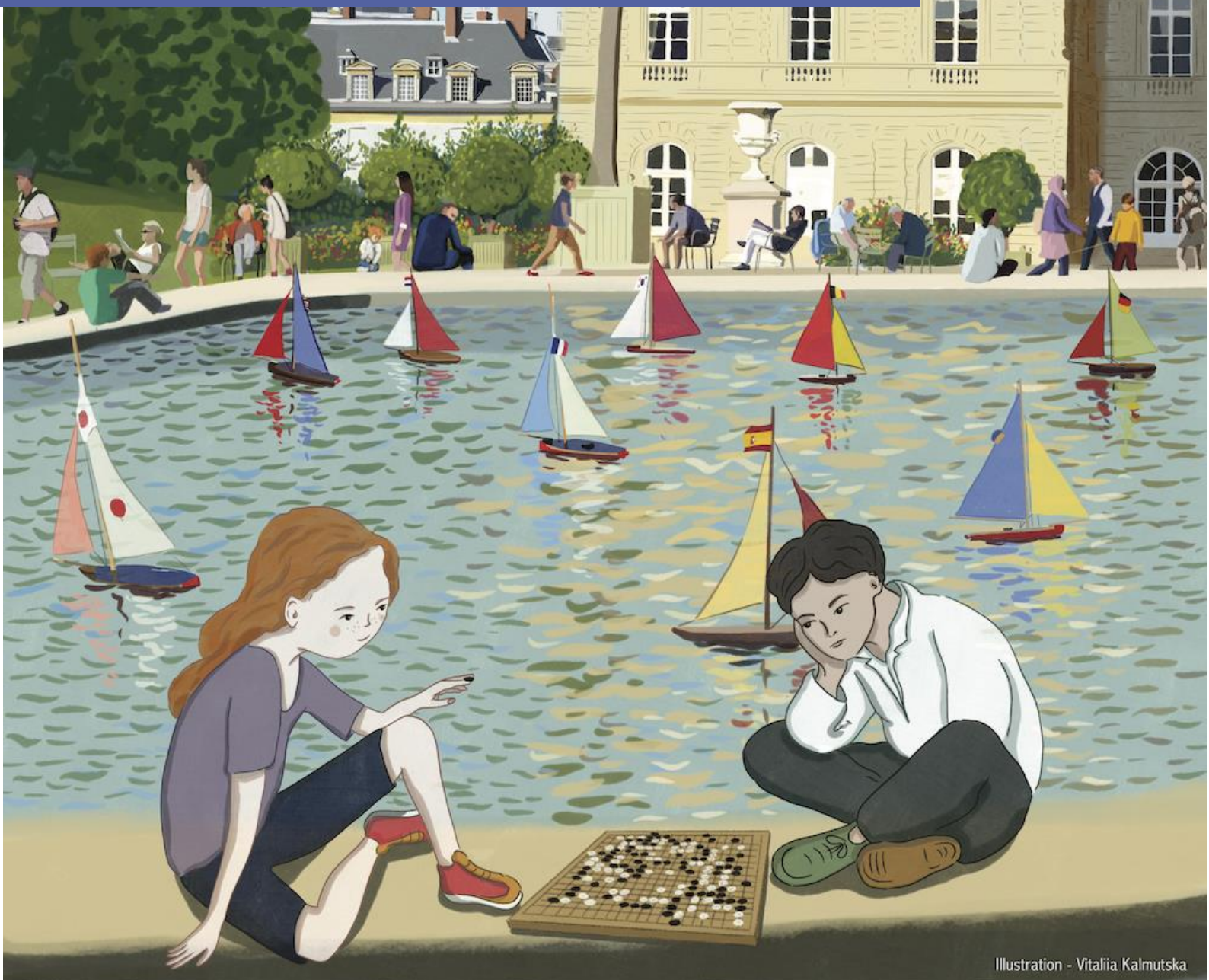
Illustration - Vitaliia Kalmutska