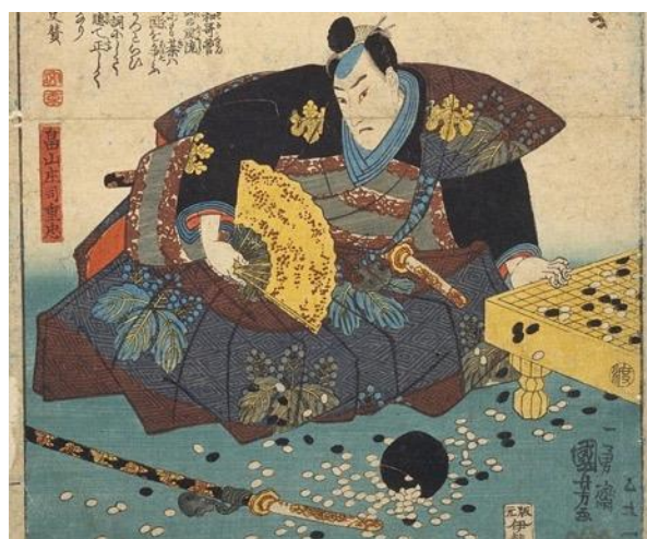
Ukiyoe de Utagawa Kuniyoshi (Genji kumo ukiyoe awase)

Le go est même un critère de sélection dans certaines hautes écoles asiatiques.