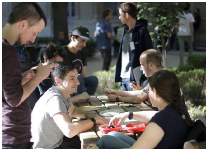
Un moment de détente dans le jardin

Les joueurs du tournoi viennent de toute l'Europe et au-delà. Parmi les plus forts, on retrouve régulièrement des champions nationaux de Roumanie, Tchéquie, Finlande, Allemagne, Belgique, Portugal... Mais aussi des joueurs asiatiques de haut niveau qui profitent de l'occasion pour visiter Paris. Près de 150 joueurs viennent de toute la France et des pays voisins (30% d'étrangers) pour participer au tournoi chaque année. Il n'y a pas de limite d'âge ou de niveau pour participer !